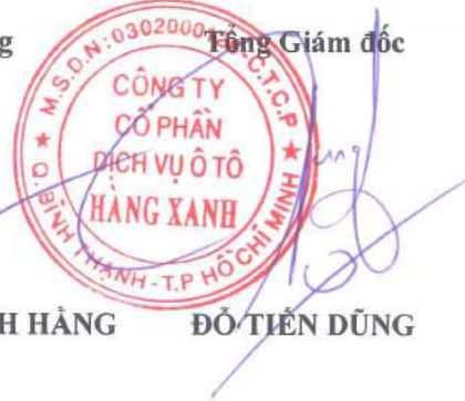
ĐỖ TIẾN DŨNG